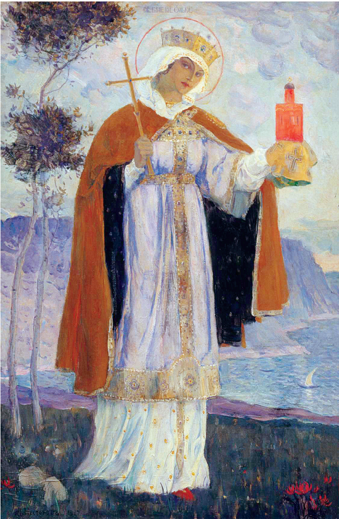
М. Нестеров. Святая Ольга. 1892 год.

русской государственности. Она объезжала русские земли, подавляла бунты мелких помещенных князей, централизовала государственное управление. Благодаря ей значительно выросла оборонная мощь Руси, вокруг городов вырастали крепкие стены, а Киев стал центром притяжения для иноземных купцов.